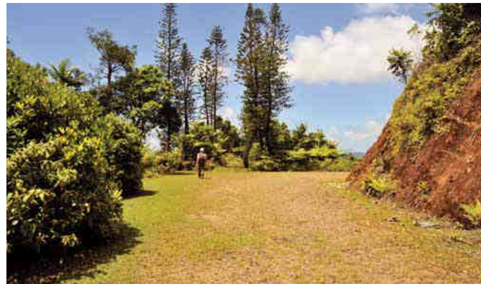
Le col du Wão Uni